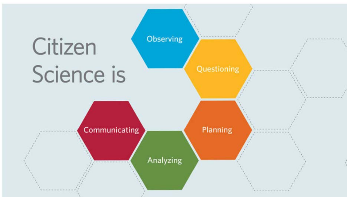
Obr. 7: Citizen Science

Občanská věda (Citizen Science) představuje zapojování dalších aktérů mimo oblast VaVal, tj. amatérských vědců z řad veřejnosti (dobrovolníků) do výzkumu a řešení přírodovědně orientovaných, ale také společenských problémů. Lze ji označit za výzkumnou spolupráci vědců a dobrovolníků, kde je vědecký výzkum prováděn zcela nebo částečně amatérskými vědci. Občanská věda může být vnímána též jako určitý typ crowdsourcingu – procesu, při němž se k dosažení cíle využívá pomoci velkého množství účastníků.